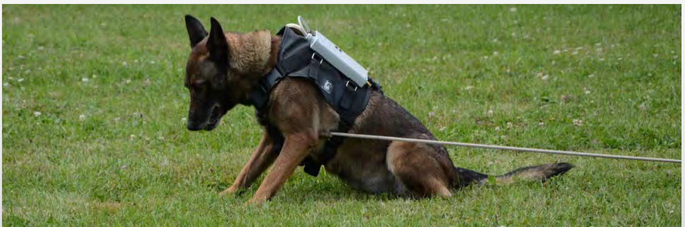
Wenn der Hund eine Mine aufgespürt hat, setzt er sich hin und markiert so die Stelle. Dann übernehmen die Minenräumer.

Obendrein sind diese Hunde glücklich. Ihre Arbeit basiert auf Spiel, Belohnung und einem hohen Mass an Vertrautheit zwischen Mensch und Tier.