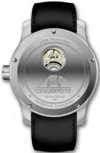
Luxus-Herrenuhr mit mechanischem Uhrwerk, Gravur DIGGER DTR und Nummerierung