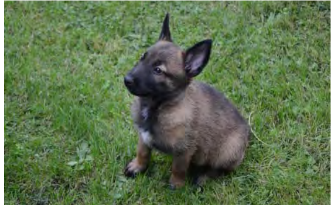
Alle Welpen kommen im Hundeausbildungszentrum NPA GTC/MDD auf die Welt. Schon in den ersten Wochen beginnt das «Puppy»-Programm. Eines Tages wird dieses kleine Fellbündel vielleicht Leben retten.

Terje Groth Berntsen, Spezialist der Hundebrigade der norwegischen Armee, ist sicherlich einer, der es am besten wissen muss: Nach Ende des Konflikts in Ex-Jugoslawien wurde er auf den Balkan geschickt, um am Wiederaufbau der Region mitzuhelfen. Und er vollbrachte Wunder mit seinen Hunden. Dennoch war Terje Groth Berntsen davon überzeugt, dass seine fantastischen