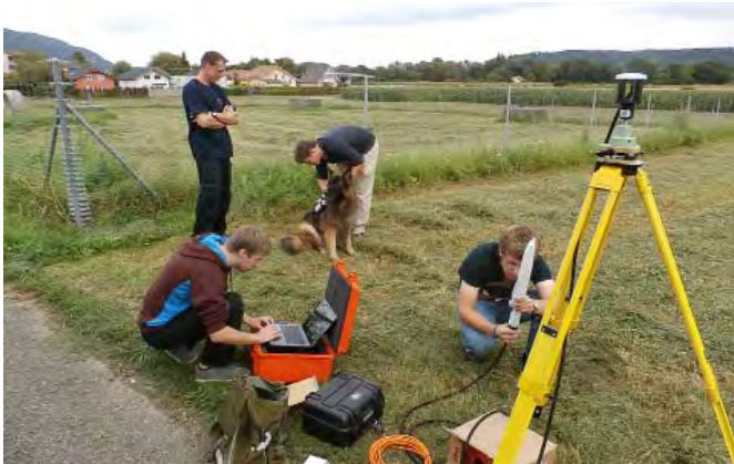
Während des Entwicklungsjahres wurde das komplette System in der Schweiz getestet. Sogar Schweizer Hunde nahmen teil!

Hunde, ebenso wie Minenspürmaschinen, können derzeit nur in kleinen, 10 x 10 Meter grossen Zonen arbeiten, die zuvor angelegt, gerodet und abgegrenzt werden müssen. Diese Vorbereitung ist mühsam und nimmt viel Zeit in Anspruch.