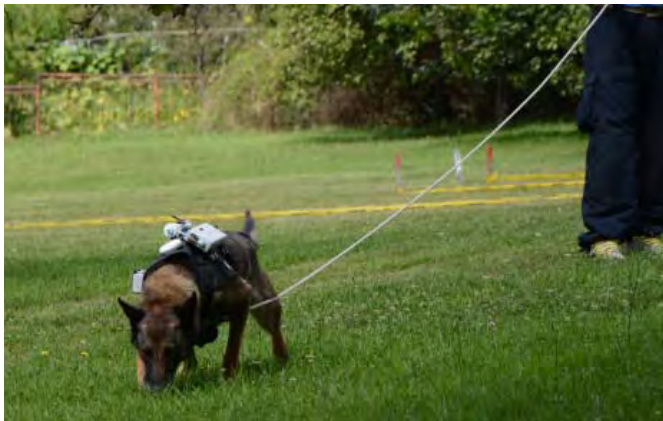
Bei der derzeitigen Methode der Minenräumung mit der Unterstützung von Hunden wird der Hund an der Leine geführt. Das bedeutet, dass vorab eine «Box» gerodet und genau abgegrenzt werden muss.

«behaarten Helfer» noch effizienter sein könnten, wenn sie speziell für die humanitäre Minenräumung dressiert würden. In Zusammenarbeit mit Norwegian People's Aid (NPA), einem renommierten Partner im Bereich der Minenräumung, gründete er in der Nähe von Sarajewo das Global Training Centre Mine Detection Dogs (GTC/MDD), ein Zucht- und Ausbildungszentrum für Minenspürhunde.