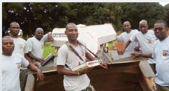
Auch die Lehrgänge zur mechanischen Minenräumung mit der DIGGER D-2 im CPADD gehen weiter.

Die Stiftung Digger arbeitet seit 2007 mit dem CPADD (Centre de Formation au Déminage Humanitaire du Bénin, Ausbildungszentrum für humanitäre Minenräumung von Benin) zusammen, um Minenräumungsfachleute in ganz Westafrika auszubilden.