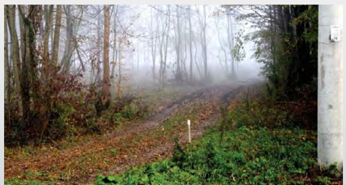
...wird zu einem Waldweg, wie man sie auch bei uns findet.