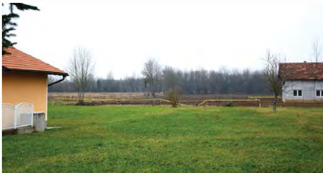
Die verlassenen Häuser...

Und so erblickten wir Anfang November 2015, nachdem sich der Morgennebel gehoben hatte, dort, wo noch vor einem Jahr 'Danger Mines'-Schilder vor dem Betreten der Fläche gewarnt hatten, bewirtschaftete Felder. Die Flächen, auf denen einst Todesgefahr drohte, sind zu Ackerland geworden. Was für eine erfreuliche und positive Entwicklung für die Bevölkerung!