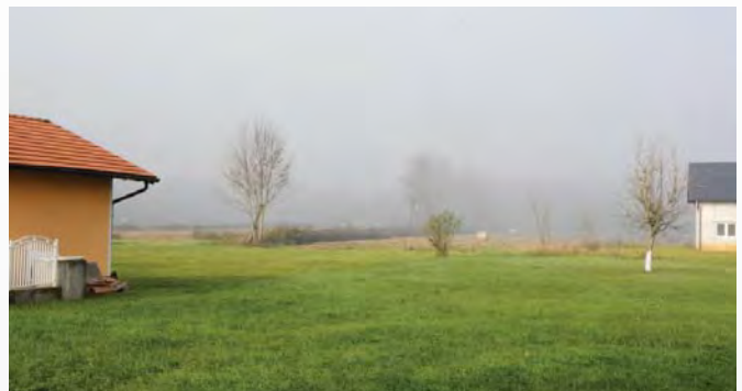
...werden wieder aufgebaut oder renoviert.

Die Zusammenarbeit zwischen NPA, dem Minenräumbataillon und DIGGER war so gut, dass der Osteuropaverantwortliche der NPA über den Einsatz und dessen Ablauf öffentlich berichten möchte, so dass er möglicherweise als Vorbild für künftige Initiativen und Partnerschaften dienen kann.