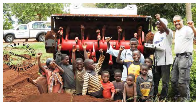
Die Bürger von Mosambik, die wichtigsten Nutzniesser, können endlich über ihren Sieg jubeln!

Die von unserem Partner intensiv und wirkungsvoll genutzte DIGGER D-3 spielte bei diesem grossartigen Erfolg eine wichtige Rolle.