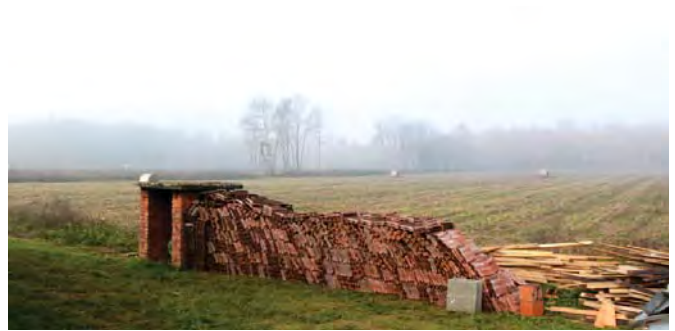
...werden zu Ackerland.

Seit einem Jahr unterstützt eine D-250 das Minenräumbataillon der bosnischen Armee und unseren Partner Norwegian People's Aid (NPA) bei der Minenräumung in Bosnien. Es war also Zeit, sich vor Ort die Ergebnisse anzusehen und Bilanz zu ziehen. Die Zahlen und die Bestätigung, dass die Ziele übertroffen worden waren, lagen schon vor – es fehlten allerdings noch einige Bilder, die die Theorie bestätigten.