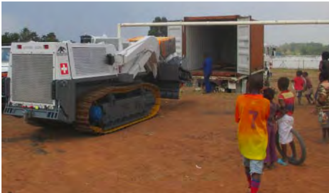
Entladen der Maschine unter den neugierigen Augen der Kinder

An diesem Oktobertag im angolischen Huambo herrschen angenehme Temperaturen: Die Gewitterwolken, die sich im Laufe des Nachmittags bilden, kündigen die Regenzeit an. Unter diesen Klimabedingungen schliesse ich mit dem Team der NGO The Halo Trust Bekanntschaft. Und auch der 20-Fuss-Container, in dem unsere Maschine zwei Monate lang unterwegs war (siehe D-News 41), ist wohlbehalten angekommen. Nach einer Besichtigung der Infrastrukturen und einem Einblick in die Organisation hole ich die Maschine direkt neben einem Fussballfeld unter den neugierigen Augen der angolischen Kinder aus ihrem Container.