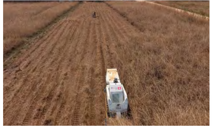
Ein von der Drohne gemachtes Foto während sie über der Maschine kreist (HT)

die Wartung und die Reparatur der Maschine ist es bereits an der Zeit, die Theorie auf dem Übungsgelände in die Praxis umzusetzen. Von Angolanern gesteuert, durchpflügt die Maschine unter dem wachsamem Auge der Drohne zum ersten Mal angolischen Boden.