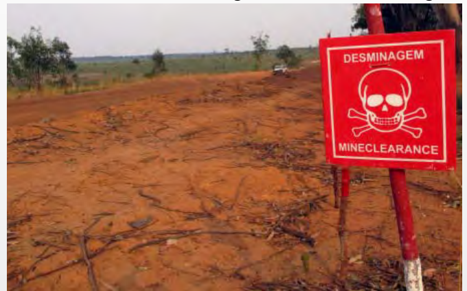
Minenfelder in unmittelbarer Nähe einer Strasse

Während das Team von dem Mechanikverantwortlichen von The Halo Trust beaufsichtigt wird, nehme ich mir ein paar Stunden Zeit für die Besichtigung zweier Minenfeldern, auf denen die Maschine zum Einsatz kommen wird, um die technische Machbarkeit zu beurteilen und mögliche Schwierigkeiten zu antizipieren. Wie wichtig die Räumung dieser Minenfelder ist, wird mir schnell klar: Aufgrund ihrer Lage an der Kreuzung zwischen einer Straße und einem Fluss behindern sie den Zugang der Menschen zum Wasser und machen jede Abweichung von der Strasse zu einem lebensgefährlichen Unterfangen.