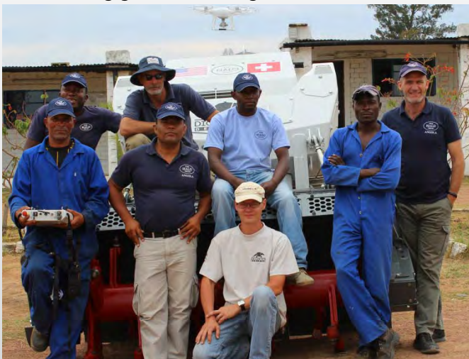
Das Team: die Mitarbeiter von Halo und Digger, die D-250 und die Drohne (HT)

Im Anschluss an die obligatorischen Gruppenfotos kann die Schulung beginnen. Trotz der Sprachbarriere gelingt es uns rasch, mithilfe von Englisch, ein paar Brocken Portugiesisch und Gesten zu kommunizieren. Es ist das erste Mal, dass diese Minenräumer eine ferngesteuerte Maschine benutzen, deren Bedienung ein wenig Übung erfordert. Zum Glück haben sie Erfahrung mit Motorfahrzeugen und verfügen über gute Mechanikkenntnisse, sodass die Fortschritte nicht auf sich warten lassen. Gleichzeitig werden andere Mitarbeiter in die Steuerung der Drohne eingewiesen, die einen Überblick über das gesamte Arbeitsgebiet gewährleistet. Nach einer mehrtägigen Einführung in die Funktionsweise,