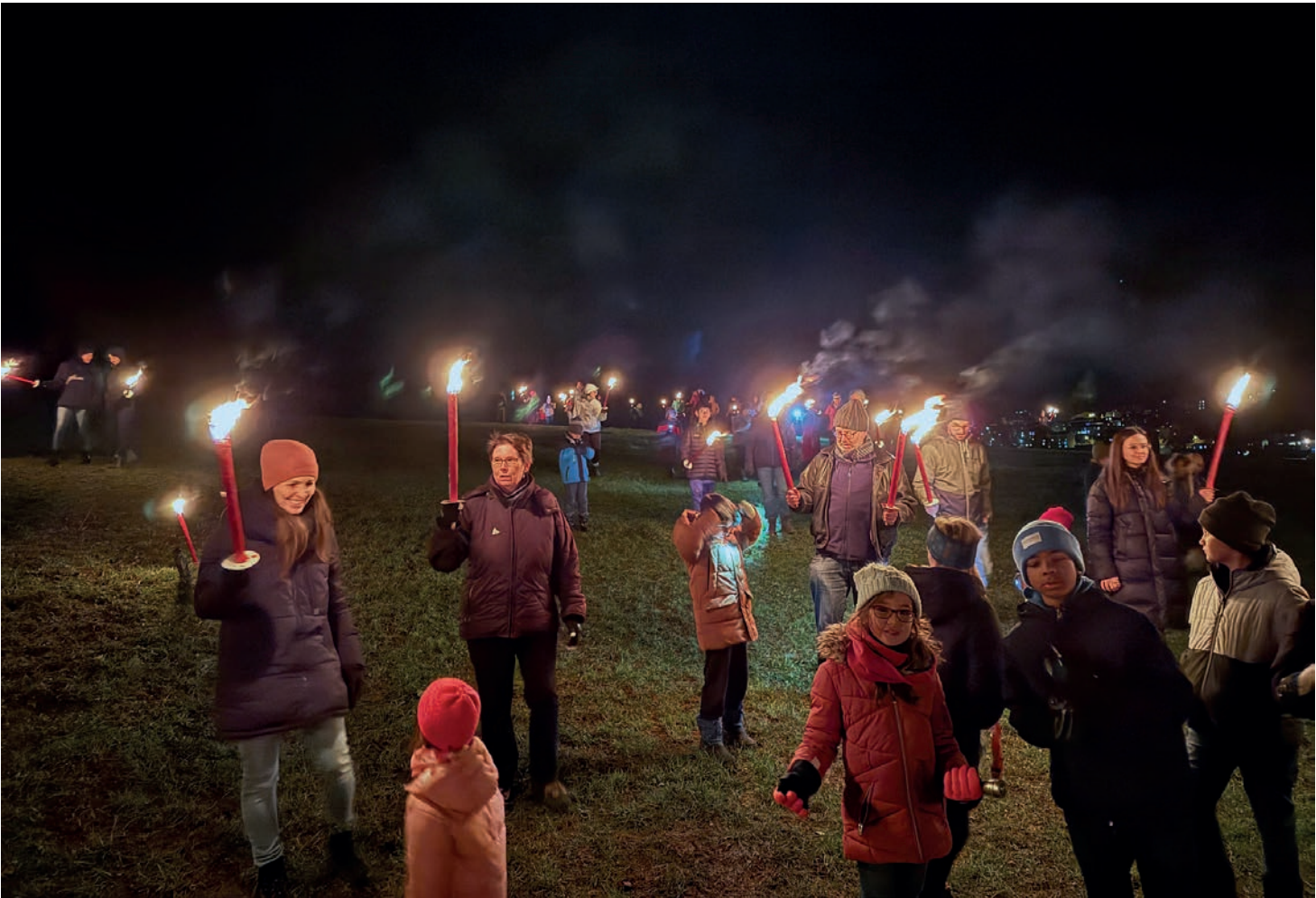
A Villeret, une marche aux flambeaux visait à sensibiliser la population à la chance de pouvoir se promener sans risque.

A Villeret, mardi soir, le Syndicat Covicou a invité la population à une marche au flambeau, lançant ainsi symboliquement cette campagne. «Le but était de montrer que nous avons la chance de pou-