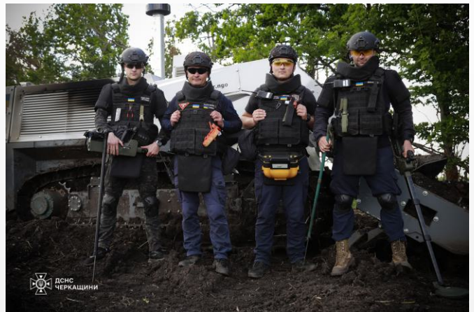
Minenräumer des ukrainischen Zivilschutzes (SESU).