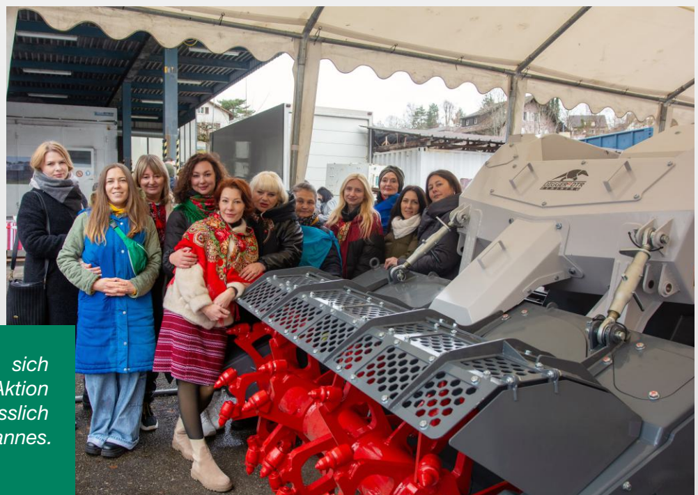
Ukrainische Frauen, die sich während der gesamten Aktion engagiert haben, anlässlich der Dankesfeier in Tavannes.