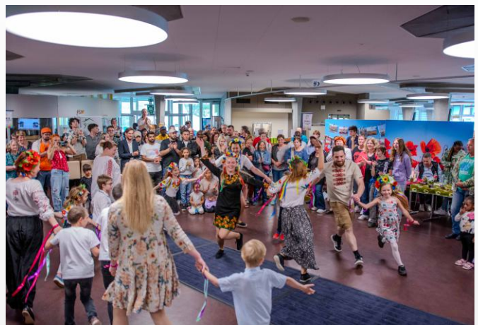
Ukrainischer Markt und Fest in Tramelan zugunsten des Projekts.