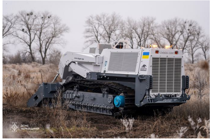
DIGGER D-250 im Einsatz in der Ukraine.