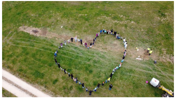
In Chandon pflanzen Schülerinnen und Schüler der Schule Reconvilier im Rahmen der Aktion Apfelbäume.